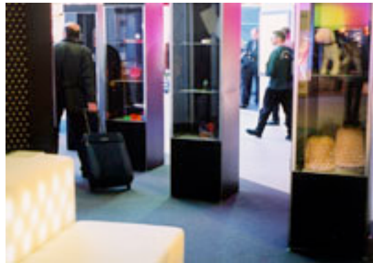
黒で統一されたシンプルな展示ブース